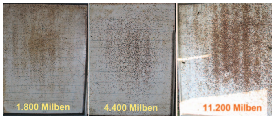
Abb. 12: Wer den natürlichen Milbenfall vor der Behandlung erfasst kann überprüfen, ob die Behandlung gewirkt hat.