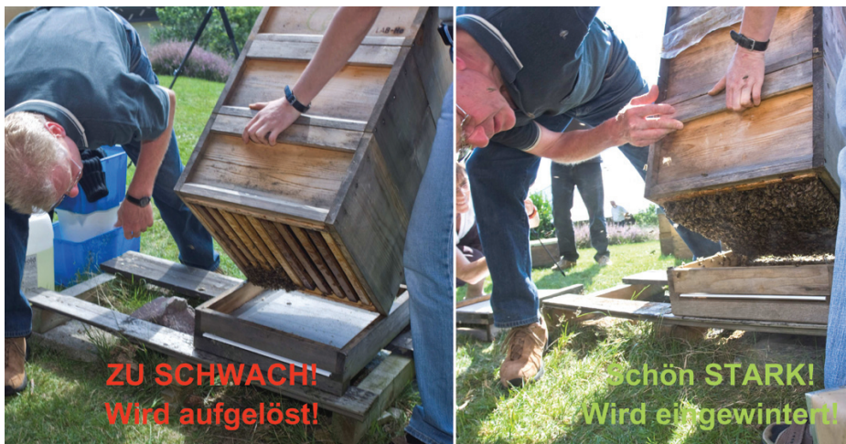
Abb. 5: Beurteilung der Volksstärke von Wirtschaftsvölkern Mitte August zu Beginn der Spätsommerpflege.

in die obere Brutraumzarge (an den dort vorhandenen Futterkranz) gezogen. Der untere Brutraum wird nun oben aufgesetzt und alle darin enthaltenen Waben in das Volk hinein abgeschüttelt (Abb.7). Auf die Königin achte ich dabei nicht. Das seit 2 Jahren bebrütete dunkle Wabenwerk ist leer und wird dem Wachsschmelzer zugeführt (Abb.8). Futtermittel sind zu dieser Jahreszeit in der unteren Zarge nicht mehr vorhanden. Auch nennenswerte Brutmengen fehlen dort. Pollenbretter jedoch finde ich in jedem zehnten Volk. Sie „rette“ ich selten und nur dann, wenn sie mindestens zur Hälfte mit Pollen belegt sind.