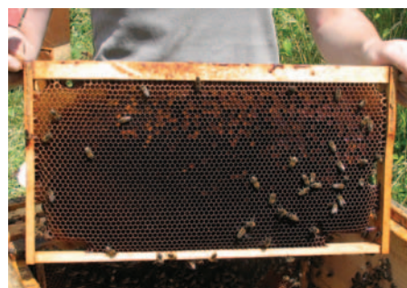
Abb. 8: Warten lohnt! Mitte August ist der untere Brutraum frei von Brut und Honig, sehr selten ist nennenswert Pollen eingelagert.

Schwächere Wirtschaftsvölker werden vereinigt, im Extremfall halbiert sich so die Anzahl meiner Altvölker. Dazu alle Bienen des aufzulösenden Volkes auf eine Rampe vor das Flugloch des bereits