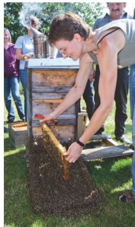
Abb. 9: Zu schwache Altvölker werden VOR Beginn der Spätsommerpflege Mitte August aufgelöst.

eingengten, zu erhaltenden Nachbarn abstoßen (Abb.9). Die bienenfreie Brut erhält das als nächstes eingengte Volk in seine neue untere Zarge. Ist sehr viel Brut zu versorgen, wird diese ausnahmsweise auch in den Ex-Honigraum gehängt. Welches von 2 schwachen Völkern aufgelöst wird, bestimmen deren Königinnen. Die jüngere und überzeugendere Königin bleibt samt Volk erhalten, die „Minderwertige“ wird beim Auflösen einfach mit vors Flugloch geschüttelt und dort in 9 von 10 Fällen von den Wächterbienen abgestochen.