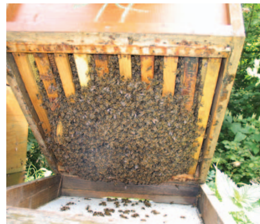
Abb. 6: So stark sollte das Bienenvolk auf 3 Zargen nach Einstellen des Flugbetriebes mindestens sein!

eingengten, zu erhaltenden Nachbarn abstoßen (Abb.9). Die bienenfreie Brut erhält das als nächstes eingengte Volk in seine neue untere Zarge. Ist sehr viel Brut zu versorgen, wird diese ausnahmsweise auch in den Ex-Honigraum gehängt. Welches von 2 schwachen Völkern aufgelöst wird, bestimmen deren Königinnen. Die jüngere und überzeugendere Königin bleibt samt Volk erhalten, die „Minderwertige“ wird beim Auflösen einfach mit vors Flugloch geschüttelt und dort in 9 von 10 Fällen von den Wächterbienen abgestochen.