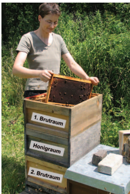
Abb. 7: Station 2 – Mitte August wird der untere Brutraum oben aufgesetzt und seine Waben abgeschüttelt und entnommen.

in die obere Brutraumzarge (an den dort vorhandenen Futterkranz) gezogen. Der untere Brutraum wird nun oben aufgesetzt und alle darin enthaltenen Waben in das Volk hinein abgeschüttelt (Abb.7). Auf die Königin achte ich dabei nicht. Das seit 2 Jahren bebrütete dunkle Wabenwerk ist leer und wird dem Wachsschmelzer zugeführt (Abb.8). Futtermittel sind zu dieser Jahreszeit in der unteren Zarge nicht mehr vorhanden. Auch nennenswerte Brutmengen fehlen dort. Pollenbretter jedoch finde ich in jedem zehnten Volk. Sie „rette“ ich selten und nur dann, wenn sie mindestens zur Hälfte mit Pollen belegt sind.