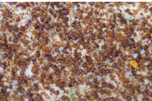
Abb. 11: Viele Milben in der Windel heißt NICHT automatisch: die Behandlung hat gut gewirkt! Überprüfen Sie den Behandlungserfolg!

● Behandlungserfolg sichern! Lassen Sie sich von der Zahl toter Milben in der Windel nicht täuschen (Abb.11)! Die Hauptursache für Winterverluste liegt in einer ungenügenden Behandlung vor der Auffütterung...und dem imkerlichen Unvermögen dies zu erkennen. Wichtig ist nicht, dass scheinbar viele Milben getötet wurden, sondern dass wenige lebende Milben oben im Volk verbleiben! Zwei Anhaltspunkte helfen mir, den Behandlungserfolg zu bewerten. 1) Ist 24 Stunden (bei MoT) bzw. 3 Tage (Liebig-Dispenser, kurz) nach Beginn der Behandlung die AS-Flasche leer und der Docht trocken, hat die Behandlung gewirkt. Ist das nicht der Fall, sofort eine neu befüllte Flasche