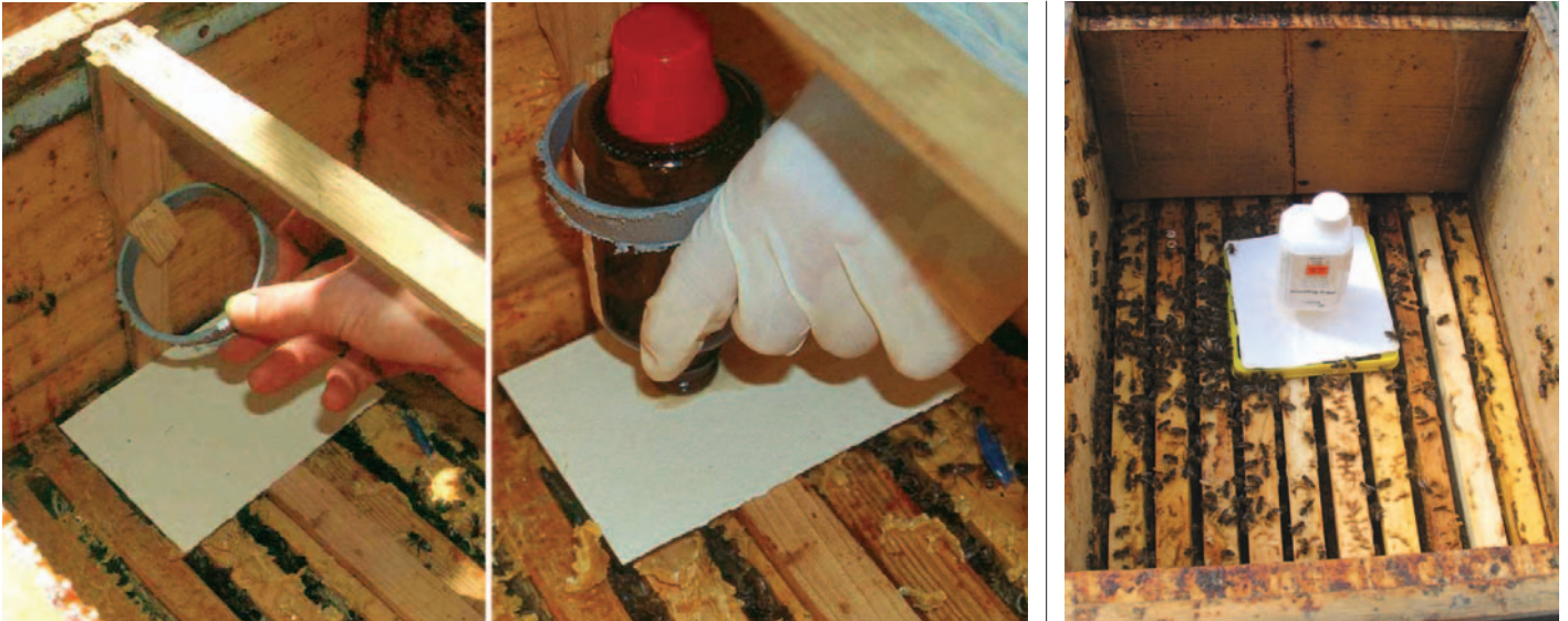
Abb. 10 a, b: Station 3 - Ameisensäure in der Variante „MoT“...oder in der Variante „Liebig-Dispenser“.