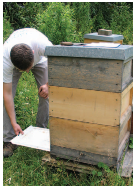
Abb. 2: Wer Milben im Gemüll auszählt, weiß ob eine Notbehandlung jetzt schon nötig ist.